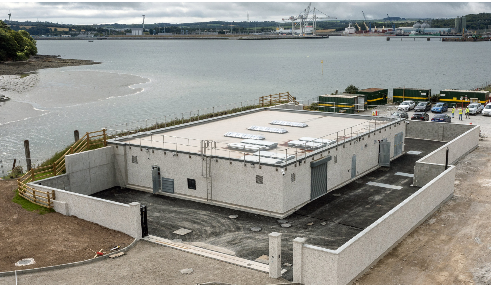
Fíor 2: Stáisiún Caidéalaithe Fuíolluisce an Chóibh, Corcaigh

A luaithe agus a forbraíodh Uisce Éireann Straitéis Fuíolluisce Chorcaí agus na Tuarascálacha Timpeallachta gaolmhara, cuirfimid tús leis an dara babhta de chomhairliúchán poiblí i ngeimhreadh 2024 ar dhréacht-Straitéis Fuíolluisce Chorcaí agus ar na Tuarascálacha Timpeallachta gaolmhara.